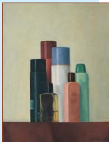
Natura morta (1989) olio su tela, 50x40