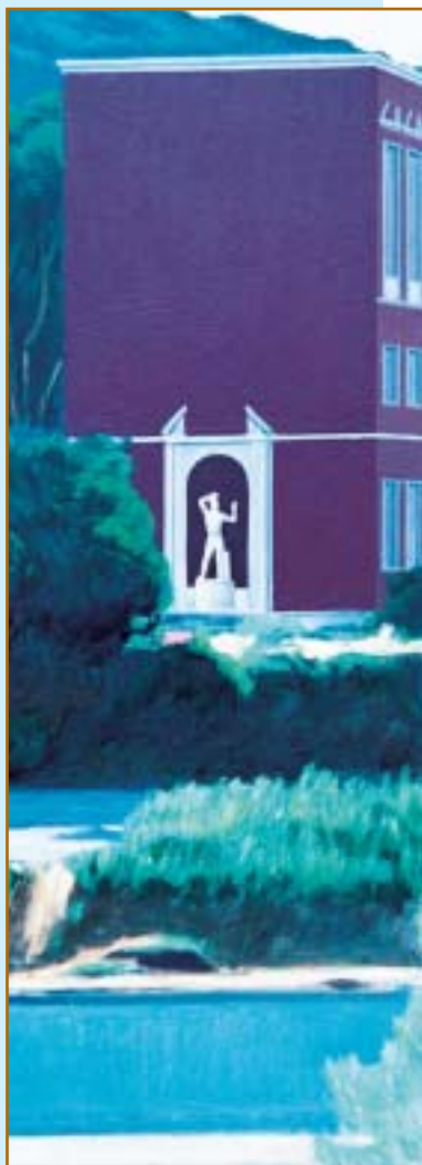
Foro italico (2001) olio su tela, 80x30