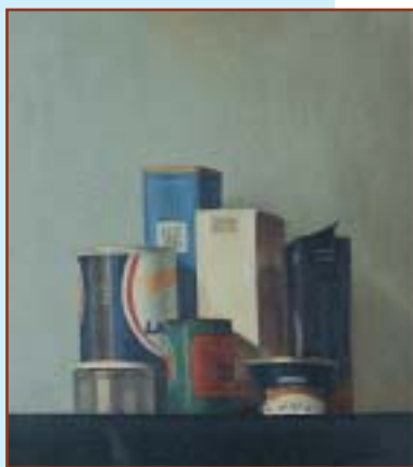
Natura morta (1990) olio su tavola, 45x40