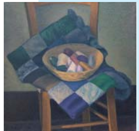
Natura morta con cestino di fili (1978) olio su tela, 50x50