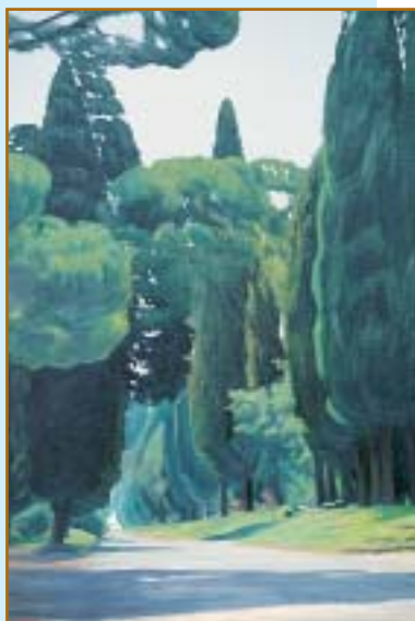
Appia Antica (1999) olio su tela, 90x60

be, appena approvata la legge, istituire i fondi della previdenza complementare. L'Enpaia vuol fare questo perché è un Ente che gestisce da 50 anni il TFR dei lavoratori dell'agricoltura; basti pensare che riscuotiamo il 6% dei contributi dai lavoratori, gli liquidiamo il 6,90% e ogni anno rivalutiamo il fondo della rivalutazione che la legge prevede per il TFR. Altrettanto avviene da 40 anni per il fondo di previdenza dei lavoratori: ogni anno rivalutiamo del 4% il fondo di previdenza, un intervento che non ha eguali nel nostro Paese. Ciò è possibile perché il nostro Ente è sempre stato gestito molto bene ed ha una redditività dei propri averi molto elevata, però l'esperienza, la capacità, la professionalità di tutti i lavoratori dell'Enpaia, che con passione hanno riorganizzato l'Ente in questi anni, rappresentano la dimostrazione che si può tranquillamente gestire il fondo complementare attraverso questo Ente bilaterale e garantire a tutti i lavoratori, così come abbiamo fatto finora per i 40 mila impiegati dell'agricoltura, un futuro pensionabile certo e ricco.