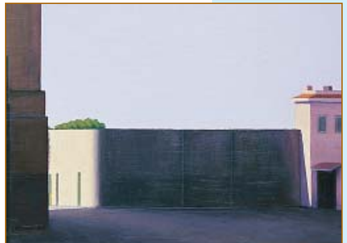
Genzano (2002) olio su cartone, 35x50