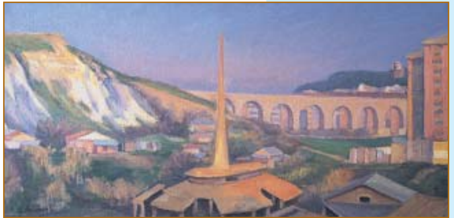
Valle Aurelia (1976) olio su tela, 30x60

La previdenza complementare è “Previdenza necessaria”