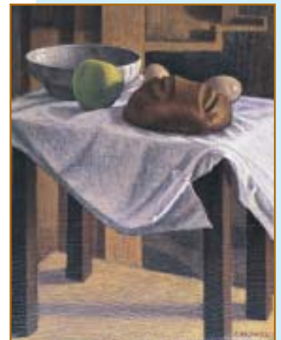
Natura morta con il pane (1981) olio su tela, 50x40