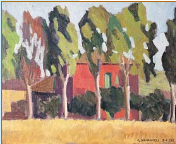
Casolare a Malagrotta (1982) olio su tela, 40x50